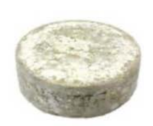
FM767 1,5 kg Tomme de Savoie IGP Mon5