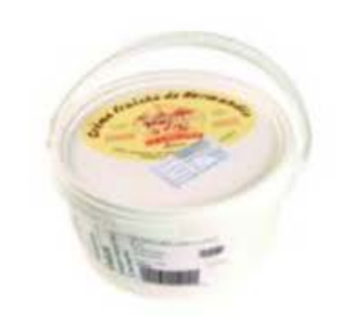
FM538 2 | Crème Fraîche epaisse 42% (Panna di latte acidificata)