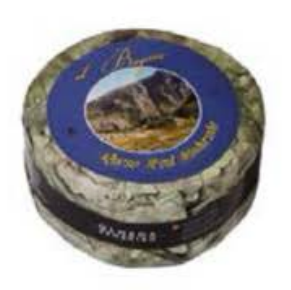
FM368 2,5 kg Azul de Cueva Olmeda Origenes