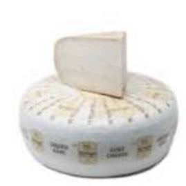
FM252 1,5 kg Gouda di capra spicchio Non Toccatemi il Formaggio

FM294 9 kg Gouda di capra forma intera Non Toccatemi il Formaggio