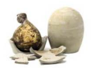
FM1824 800 g ca. Cocciuto in terra cruda Campania Formaggi.it

FM879 4 kg Castelmagno d'alpeggio DOP 2021 Piemonte - forma intera Formaggi.it