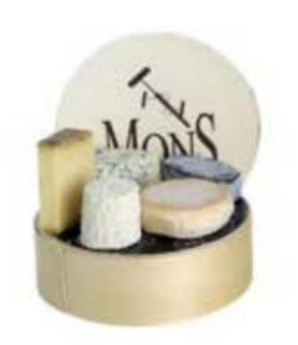
FM064 1 kg Plateau Cadeau 5 pezzi MonS