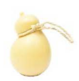
FM835 1,3 kg Caciocavallo semistagionato BIO Puglia Querceta