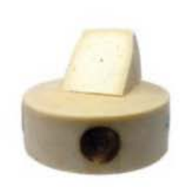
FM176 1,6 kg Vezzena dolce Trentino - spicchio Formaggi.it

FM198 8 kg Vezzena d'alpeggio Trentino - forma intera Formaggi.it