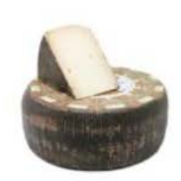
FM131 1,2 kg Tuma Persa Sicilia - spicchio Formaggi.it

FM162 10 kg Tuma Persa Sicilia - forma intera Formaggi.it