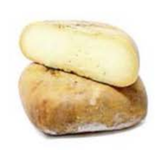
FM367 1,3 kg Mahon Menorca DOP mezza forma Olmeda Origenes

FM366 2,5 kg Mahon Menorca DOP forma intera Olmeda Origenes