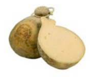
FSC137 1,8 kg Caciocavallo Podolico riserva Puglia Formaggi.it