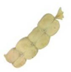
FM142 1,3 kg Pecorino infossato Emilia Romagna Formaggi.it