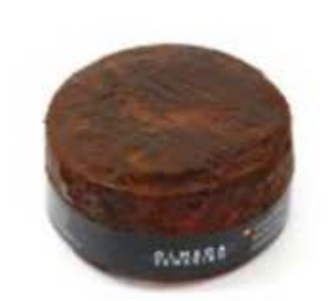
FM374 1,5 kg Queso Canario Olmeda Origenes