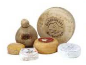
FSC249 3 kg Platò della Primavera (disponibilità mar-giu) Formaggi.it

FSC245 2,9 kg ca. Platò del Sole (disponibilità giu-set) Formaggi.it