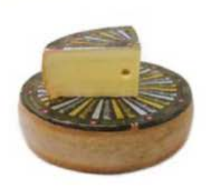
FM409 1,6 kg Appenzeller extra spicchio Swisscru

FM4087kg Appenzeller extra forma intera Swisscru