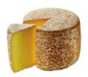
FM762 2,5 kg Cantal DOP spicchio MonS