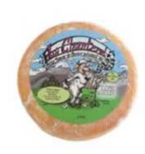
FM297 1,3 kg Chanteral Non Toccatemi il Formaggio