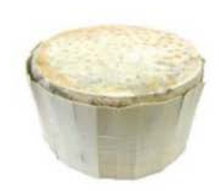
FM112 1,5 kg Gorgonzola dolce DOP Piemonte - spicchio Formaggi.it

FM900 4,5 kg Formai de Predacia Trentino - forma intera Formaggi.it