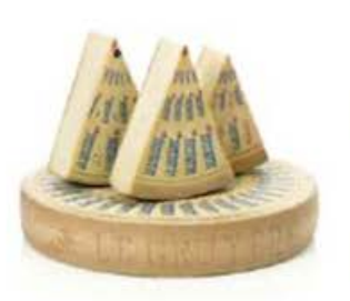
FM406 1,7 kg ca. Gruyère Des Grottes DOP 16-20 mesi - spicchio Swisscru

FM404 32 kg Gruyère Des Grottes DOP 16-20 mesi - forma intera