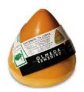
FM364 1 kg San Simón Da Costa Olmeda Origenes

FM376 2,7 kg Manchego artesano Gran Reserva DOP Dehesa de los Llanos forma intera Non Toccatemi il Formaggio