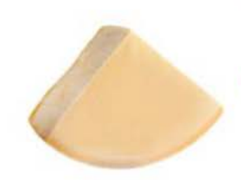
FPR028 4,5 kg Parmigiano Reggiano DOP 18 mesi - spicchio 1/8 Formaggi.it