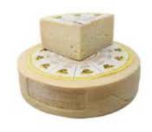
FM121 1,25 kg Carnia stagionato Friuli-Venezia Giulia - spicchio Formaggi.it

FM199 5 kg Carnia stagionato Friuli-Venezia Giulia - forma intera Formaggi.it