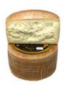
FM377 1,4 kg Manchego artesano Gran Reserva DOP Dehesa de los Llanos mezza forma Non Toccatemi il Formaggio

FM366 2,5 kg Mahon Menorca DOP forma intera Olmeda Origenes