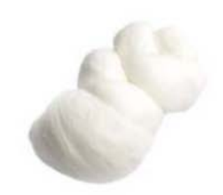
FM733 1 kg Treccia Fiordilatte Puglia Formaggi.it